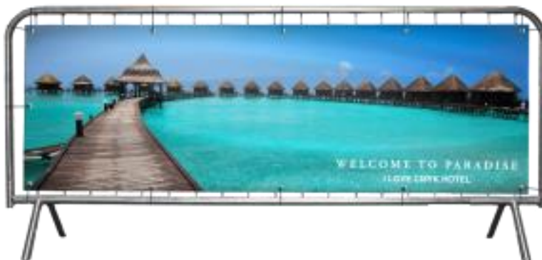
dranghekbanner voorbeeld 2